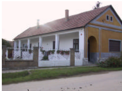
- lakóház-1 -

Leírás Az épület tömege és egyszerű pillérsoros tornácsa, hagyományos nyílászorrendje és nyílászorai valamint az utca kanyarulatát követő falazott kerítése és melléképületei a községképben fontos szerepet töltenek be helyi építészeti értékéért véendő.