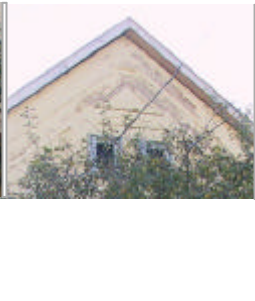
- utcai tornácbéjárati ajtó -