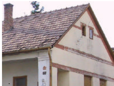
- homlokzati részlet -

Leírás Az érintetlen hagyományos épülettömeg a vele egybeépült gazdasági épülettel egységes portát képez. A rendkívül finom díszítésű utcai homlokzat külön értéke a szép tornác mives vésett külső ajtaja.