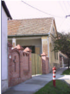
- téglakerítés, deszkakapu -