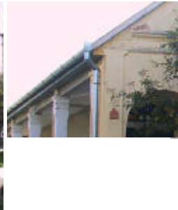
- utcai vakolatdísz, tornácoszlop fejezet -