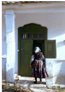
- lakóház-2 bejárati ajtó -