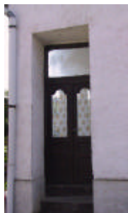
- tornác bejárati ajtó -

Leírás Az épület hagyományos tömegformálása a széles ereszszerű, az udvari hagyományos nyílászorrendje és melléképületei az utcakép értékes részét képezik.