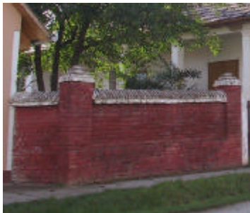
- téglakerítés oszlopokkal -