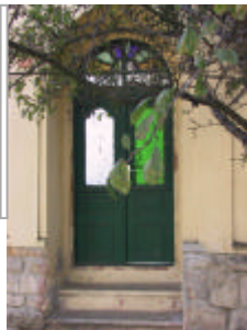
- utcai tornácbéjárati ajtó -