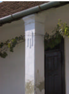
- fejezetes tornácsózlop vakolatdíszszel -