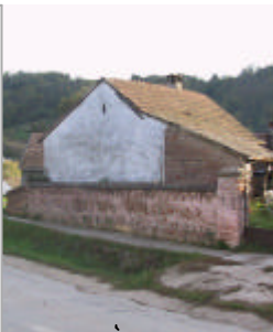
- melléképület -