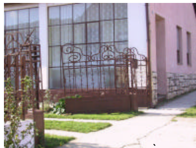
- kovácsoltvas kapu -