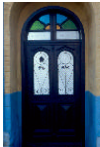
- lakóház-1 tornácbejárat -