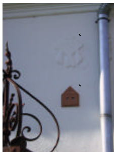
- udvari homlokzatdísz -