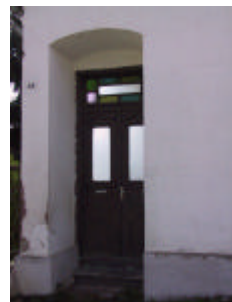
- utcai tornácajtó -

Leírás A jelentősen megváltozott megjelenésű épület hagyományos tömege az eredeti formában megráncsolt szép vésett utcai tornácajtó, a gondos bádogosmunkával készült ereszcsonnya üst és a rendkívül gazdag hajlékony vonalvezetésű kovácsoltvas kapu, védendő helyi építészeti értéket képvisel.