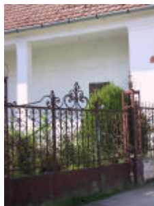
- kovácsoltvas kapu és kerítés -