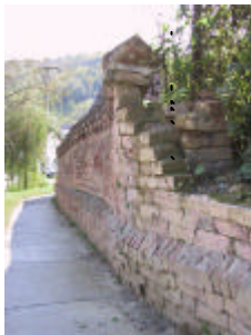
- téglakerítés 2 -