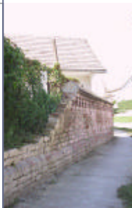
- téglakerítés 1 -