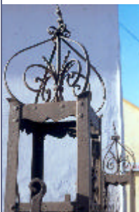
- kovácsoltvas oszlopfej -